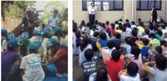
▲エコっち君を使って苗を植えました ▲真剣に説明を聞いてくれています。