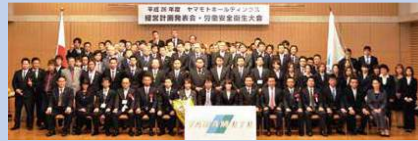
▲第100回 ヤマモトホールディングス 経営計画発表会・労働安全衛生大会

コミュニケーションです。同様に、新入社員にコミュニケーションの大切さを教えることを最重要項目と考えます。 そのカギとなるのが、新入社員にとって一番身近な指導員となる先輩・上司との「信頼関係」です。きめ細やかなコミュニケーションを通じて新入社員の心に寄り添い、支援することで、新入社員は「見守られていること」を実感しながら安心して仕事に取り組むことができます。上司として部下に威厳を見せるために仕事以外の話をしない、という姿勢も部下とのコミュニケーションが十分に摂れているとは言えず、信頼関係は築けていません。信頼できない人から、あれこれ指示されても部下は素直に受け入れてはくれないでしょう。 モチベーションをアップさせるために、「小さなこと、ささいなことでもできるだけ褒める」というのも、コツの一つと言っていでしょう。また、一生懸命に目をかけた新入社員が、仕事で成果を出した時は、自分の事のように嬉しく思うことでしょう。より良いヤマモトホールディングスとして変革の第一歩、来春の彼らの入社日まで受入れ体制を整えていきましょう! 本年もより良い社員総会にする為、みんなで力を合わせ頑張りますよ!