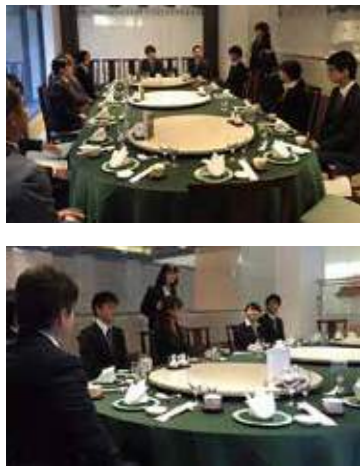
▲新卒者、内定式及び懇親会の様子

教えることは学ぶことです。新入社員を指導することで自分の業務内容や方法、その意義について再認識できる機会、改めて自分の方法を見直せるチャンスなのです。実際に仕事のやり方などを説明しているうちに、その重要さを再確認できたり、新たに効率的な方法を思いついたりすることもあります。新入社員とともに、自分自身もさらに成長することができるのです。新入社員の受け入れ側にとって重要な心構えは「自分自身の成長につながる機会だと認識し続ける」こと正しいやり方を示してみせるのは効果的な指導法ですが、なぜそのやり方が正しいのかを説明できなければ効果が半減してしまいます。いちいち説明するのは面倒に思えますが、この方法は指導される側だけでなく、指導する側にとっても効果があります。理由を説明することで正しさを証明すると同時に、自身の指導方法を見直して行くきっかけにもなるので、より効果的な指導をすることができるようになるでしょう。指導を通じて新入社員を育成するだけでなく、先輩・指導者側が指導方法を見直すことで管理術やコミュニケーション方法を見直すきっかけにもなります。過保護になるのも考え物ですが、丁寧に教育する姿勢をもっていなければ、戦力になる前に辞めてしまう新入社員が続出するでしょう。良いチームをつくるために最も大切なことは、