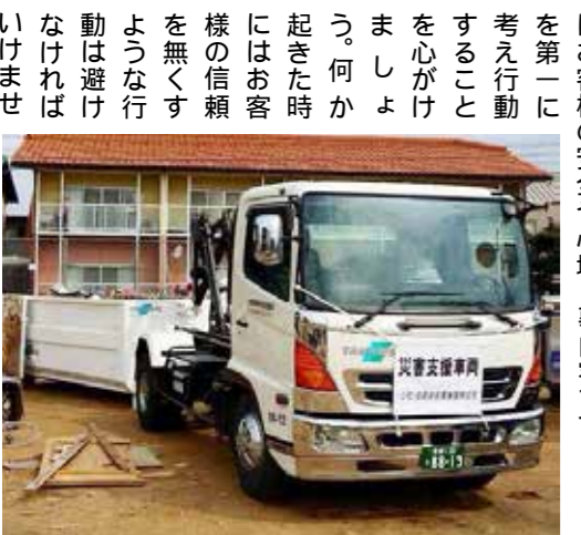
福知山市へ災害支援活動に向かいました。

現場では我々だけでなく多くの企業、また有志が集まった方々、地域の高校生がボランティア活動に集まっています。京都府外からも駆けつけてくれた方々もおり、人間の絆というものがいかに大きいものか、この思いを次に繋いで、どんな大きなものにしていくか、天災に對する最大の対策に、我々もその一助を担うていきたいと思います。