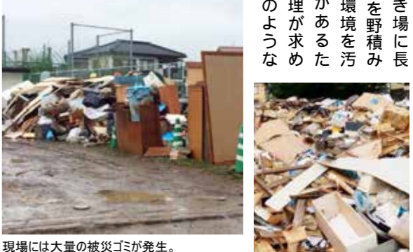
現場には大量の被災ゴミが発生。

この度の京都府北部を襲った豪雨により、甚大な水害を被った福知山市内の支援に山本清掃グループも参加しております。現場では川の水位が上昇し、大量の被災ゴミが溢れていました。床上浸水等の被害にあり、住民の方々も大変苦しい思いをされているようでした。災害後の復興のために、災害廃棄物を撤去することが必要となります。撤去された災害廃棄物を一度に処理することは困難であるため、一時的に仮置き場に集積され、順次処理されることになりました。